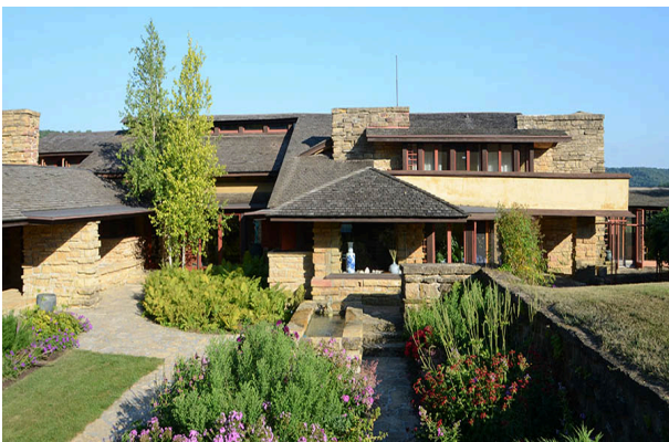
スプリング・ガーデン(タリアセン・トレイル)

アメリカの歴史的ランドマークとして登録された、この時代ライトが建築した住宅全15棟を検証して歩きます。1909年以降ライトは執筆と教鞭を振るうことに多くの時間を費やし、タリアセンフェローシップをウィスコンシン州スプリンググリーンに構築しました。今回車で訪れる、FLWタリアセントレイルはその時代のライトの足跡を辿るものです。その後ライトと弟子達は極寒の冬をより凌ぎやすくするためにアリゾナ州にタリアセン・ウェストを建設しましたがそれは次回のお楽しみとしましょう。その後のライトの建築は、東京の帝國ホテル、等日本にもいくつか残っていますが、今回のツアーの締め括りは、デパートオーナーエドガー・カウフマンのオーダーで建てたペンシルバニア州ミルランの落水荘「Fallingwater」、そして近くにあるケンタックノブを訪問し、自然との共存を意図した住宅を視察することになっています。