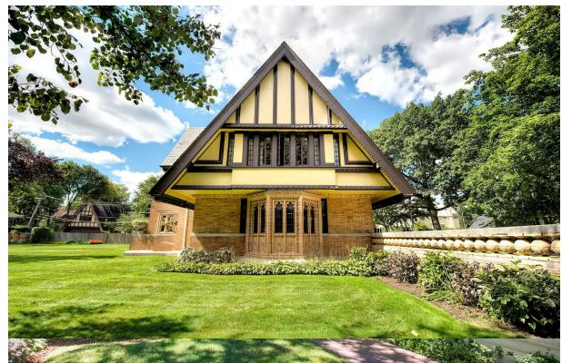
ムーア・ハウス(オークパーク)