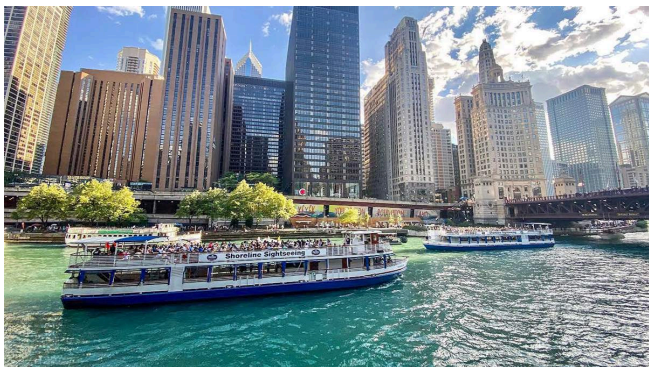
シカゴ 摩天楼ボートツアー